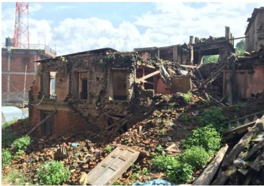
町の中心から奥に入った地域の現状