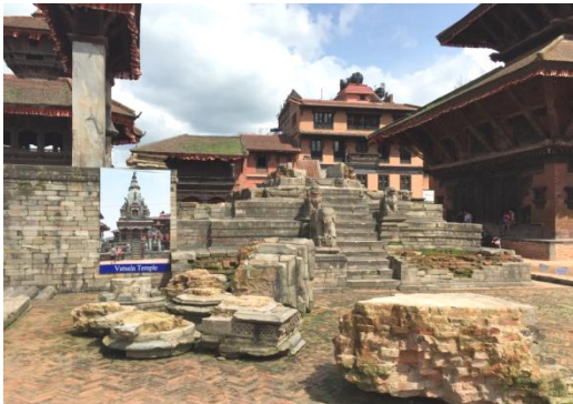
倒壊した世界文化遺産の残骸