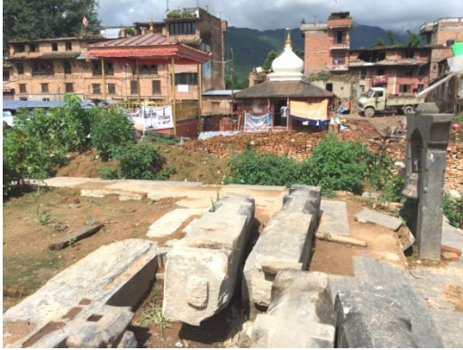
倒壊した寺院の石柱