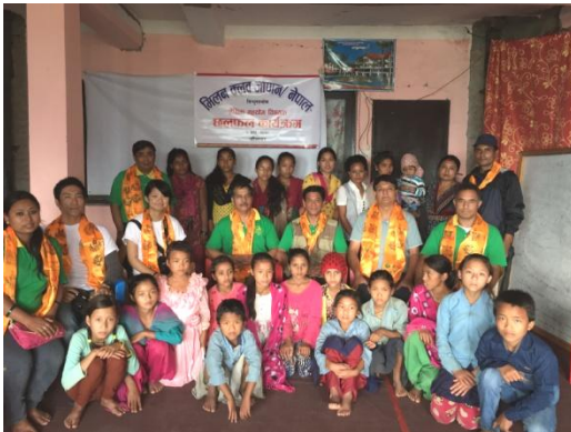
集まった里子たちと家族

スレスタ支部長からミランクラブの活動に感謝の言葉があった。里子の支援に留まらず、ミシンの職業訓練の支援や、こうした大地震で困った際の支援などに感謝している旨の言葉と感謝状を受け取った。今後地域を立て直すため可能な限りの協力をお願いとしての要請書も手渡された。要請書にはミシン教室の継続、里子の通っている学校の屋根の修理、地震による断水の解決のお願いなどが書かれてあった。