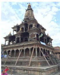
つかい棒をされる寺院群