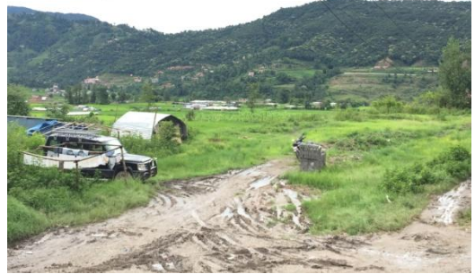
里子の仮住まいが見える村の風景