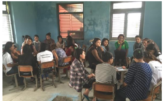
里子たちとの交流

いつ起きてもおかしくない時期にあったネパールの地震、被害を大きくしたのは以下によるものだった。