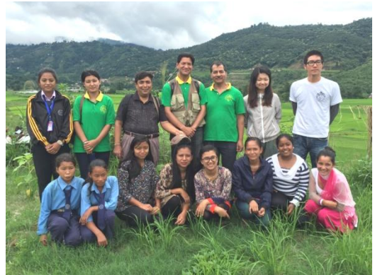
サンク村の里子たちと一緒に

サンクはカトマンズから約1時間のところにあり、チベットとの交易で栄えた。カトマンズやパタンに似た古都であるが、チベットへの別の幹線道路が40年ほど前にできてからは役目を終えたかのように、中世の佇まいのまま残されたのである。今回の大地震での被害が大きい地域の一つとなってしまった。