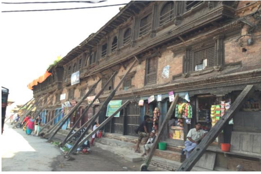
王宮前広場にある建物を支える棒