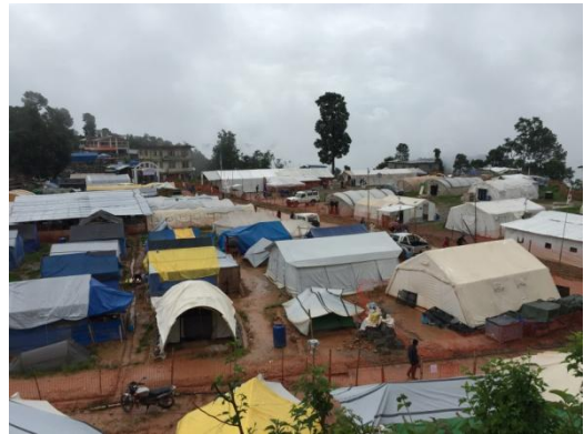
広場にできたテント村

シンドゥパルチョク郡は、カトマンズからバクタプール、バネパを通過してチベットへ向かう幹線道路を經由して途中から山奥へ向かう道沿いにある地域である。山道は舗装されていたが、地震による山崩れが所々あり、また被災地に近づくにつれ、地震の爪痕が多く見受けられるようになってきた。チョウタラの入口は国際支援団体の車5、6台や大型バスで通行できず、私たちは車を降り歩いて町に入った。カトマンズを出て車で約4時間半かかっていた。被災地は雨だった。