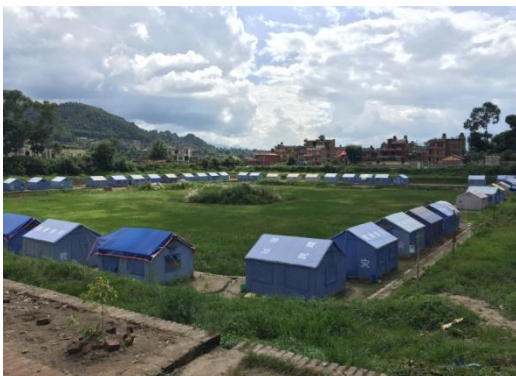
世界各国からの支援団体のテント村